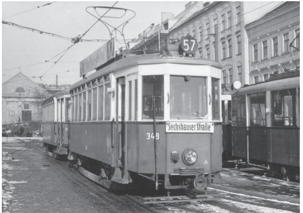
G4 348 mit k 3 3639 im Bhf. Rudolfshheim.