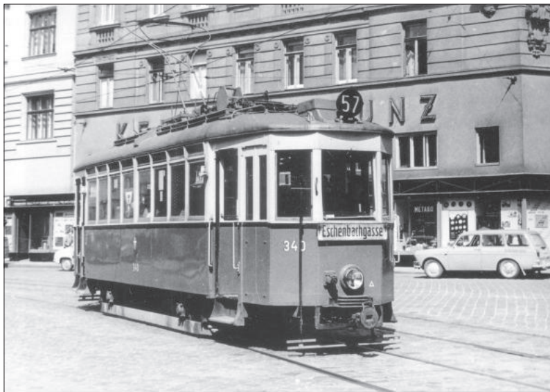
G4 340 in der Gumpendorfer Straße beim Lutherplatz.