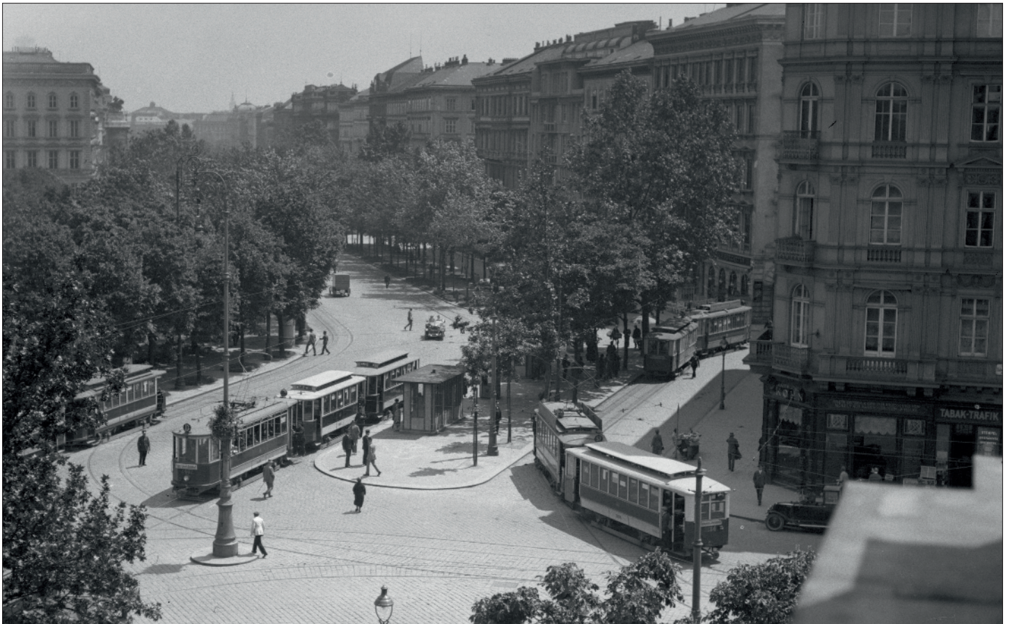
Ein Zug der Linie 57 fährt noch Linksverkehr in die Endstelle am Burgring ein. Links im Bild ein Zug der Linie D.