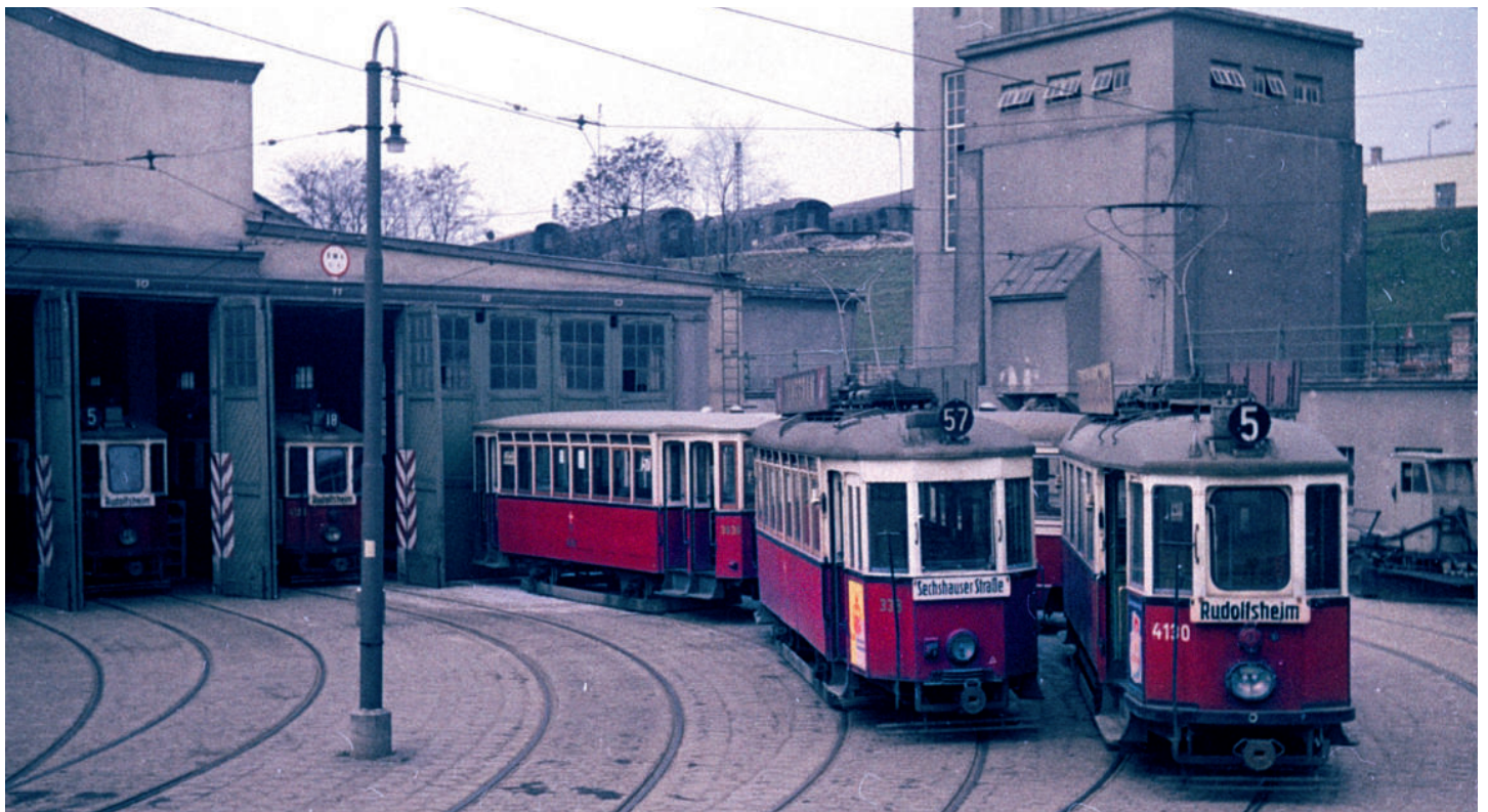
G4 333 mit k 3 3636 bereit gestellt im Bhf. Rudolfshheim.

7.4.1963