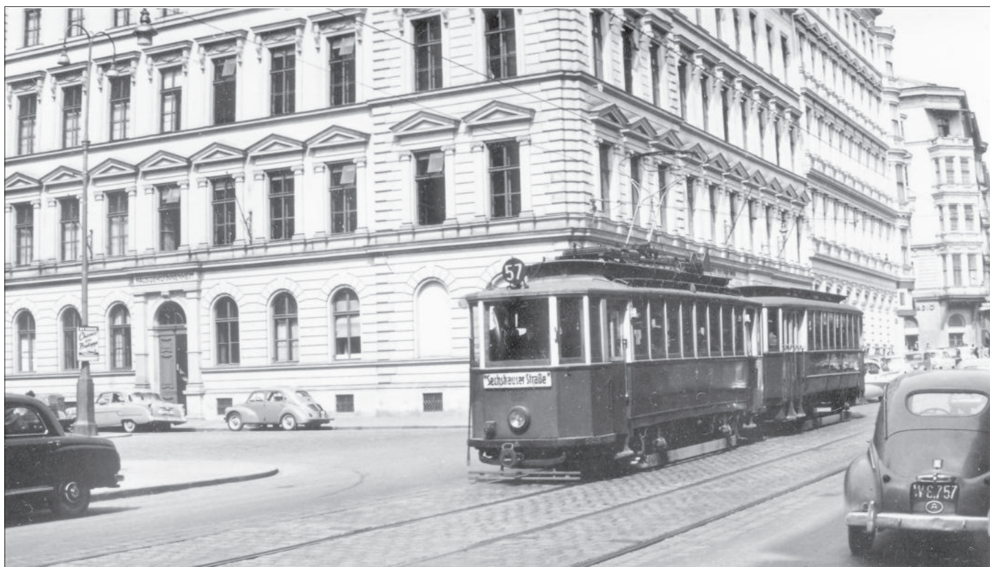
G 661 mit k 1 3237 auf der Linie 57 in der Gumpendorfer Straße bei der Rahlgasse.