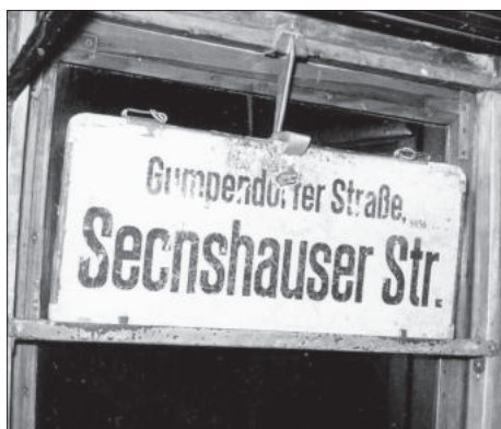
Innenbesteckung für die Linie 57

Die Linienführung war: Eschenbachgasse — (Schleife Burgring über Elisabethstraße - Babenbergerstraße — Burgring (ab 8.9.1923)