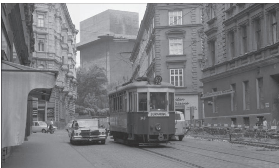
G 349 in der Gumpendorfer Straße nach der Amerlingstraße.

Da die Linie 57 weiterhin an Sonn- und Feiertagen nach Bedarf verkehrte, ließ man die Linie 157 nach einigen Jahren auf und ließ die Linie 57 wieder täglich ab 15.7.1936 bis zur Weiglasse verkehren, und zwar bis 31.5.1941. Wegen Sparmaßnahmen war ab 3.6.1941 nur