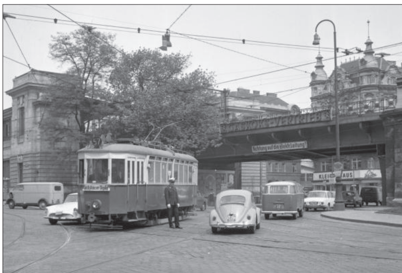
G4 350 auf der Kreuzung Sechshäuser Gürtel mit der Sechshäuser Straße. Damals fuhren die Linie 8 und 18 hier den äußeren Gürtel.